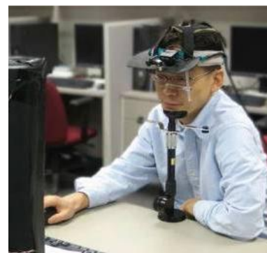
Fig.3 : Exemple d'oculomètre.