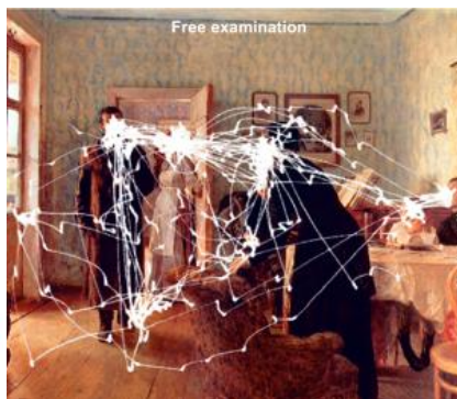
Fig.2 : Zones de fixation du regard lors de la visualisation d'un tableau [2].